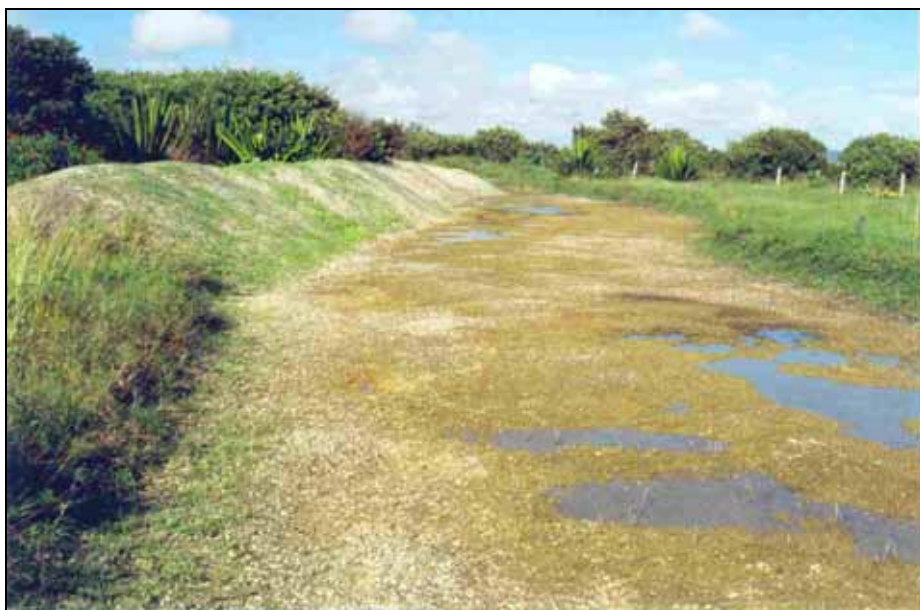
Figura 7 - Remoção da camada de solo, área do afloramento de coquina - Reserva Tauá.

Embora os depósitos de conchas de moluscos da Região dos Lagos Fluminenses sejam conhecidos através da exploração por dragagens na laguna de Araruama há algumas décadas, somente no último decênio iniciaram-se tentativas de proteção e conservação deste patrimônio científico-cultural. No final da década de noventa a ambientalista Tereza Kolontai Soldan orientou uma escavação na região da Reserva Tauá - pântano da Malhada com a finalidade de proteger o jardim botânico de sua propriedade de incêndios florestais frequentes na região. Com a remoção do capeamento de solo foi descoberto o afloramento de coquina em excelente estado de preservação ambiental (Fig. 7).