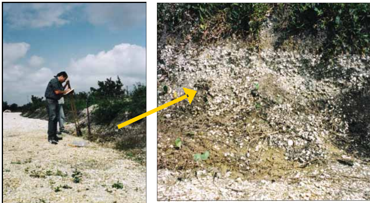
Figura 2 - Aspectos gerais e de detalhe do afloramento de conchas de moluscos “coquina” na área da Reserva Tauá - pântano de Malhada / Estado do Rio de Janeiro.

A formação da paleolaguna da Reserva Tauá aconteceu após uma fase de afogamento do sistema de drenagem da região devido à transgressão marinha de 5.100 anos AP. Durante esse período transgressivo, as barreiras arenosas deslocaram-se rumo ao continente, provocando a formação de canais de ligação entre diversas lagunas da região. As datações de conchas coletadas no afloramento estudado forneceram uma idade através do método 14 C de 5.034 a 5.730 anos AP, intervalo de tempo considerado aqui como o de formação da paleolaguna da Reserva Tauá (Castro et al. , 2004).