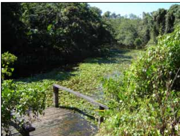
Figura 4 - Fisionomias de vegetação de restingas, Reserva Tauá - pântano da Malhada.

No limite nordeste do afloramento registra-se uma área de vegetação arbórea e arbustiva constituída por fisionomias de vegetação de restinga de propriedade particular da ambientalista Tereza Kolontai Soldon ( Fig. 4 ). O restante da área de entorno do depósito de coquina é constituído por vegetação de gramíneas, lavouras de subsistência e ocupação urbana de áreas de terras baixas.