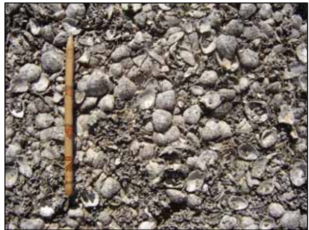
Figura 5 - Distribuição espacial das conchas de moluscos com notável padrão de aninhamento

Os primeiros estudos sobre os depósitos de coquinas da Reserva Tauá evidenciaram níveis de bioclastos com extensão vertical de até 0,60 m. A distribuição das conchas ocorre de forma caótica em seção com predomínio de bivalvíos suspensívoros (Senra et al. , 2003). O depósito apresenta-se densamente empacotado seguindo a orientação da paleopraia. Os componentes biominerais caracterizam-se por distribuição espacial côncava, convexa, ancorada, imbricada e articulada com notável padrão de aninhamento ( Fig. 5 e 6 ).