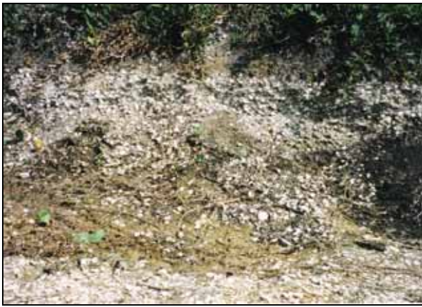
Figura 3 - Posicionamento estratigráfico do afloramento de conchas de moluscos "coquina" na área da Reserva Tauá - pântano de Malhada / Estado do Rio de Janeiro.

Figure 3 - Stratigraphic positioning of the molusk shells outcrop "coquina" Reserva Tauá - Malhada marsh / Rio de Janeiro State.