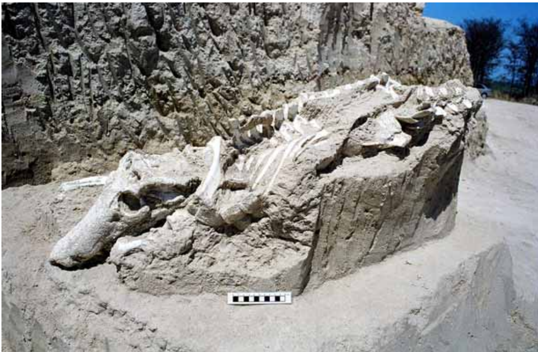
Figura 2 - Fóssil de Uberabasuchus terrificus encontrado no Ponto 1 (Caieira) do Sítio de Peirópolis Figure 2 - Uberabasuchus terrificus fossil found at Point 1 (Caieira) of the Peirópolis Site