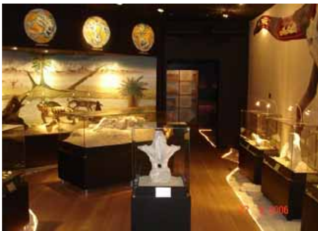
Figura 10 - Exposição do Museu dos Dinossauros Figure 10 - Exposition of the Dinosaurs Museum (Museu dos Dinossauros)

Para levar o conhecimento ao público leigo de forma simples e didática, foi criado o Museu dos Dinossauros (Fig. 10). Funcionando anexo ao Centro de Pesquisas, sua mostra inclui: réplicas, cenários, dioramas, além de um acervo bastante representativo de fósseis dos diversos componentes da biota desta região, em especial os dinossauros.