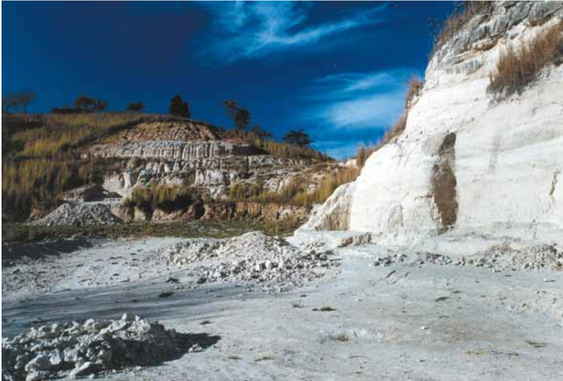
Figura 1 - Sítio Paleontológico de Peirópolis - Ponto 1 de Price, 1946 a 1970 (Caieira) Figure 1 - Paleontological Site of Peirópolis - Point 1 Price, 1946 a 1970 (Caieira)

Dentre as diversas localidades de onde foram recuperados exemplares fósseis, destacam-se os Sítios de Peirópolis (Figs. 1 e 2) e Serra da Galga (Figs. 3 e 4) que se notabilizaram especialmente nestes últimos 7 anos, trazendo à luz do conhecimento informações bastante relevantes numa explosão de novos achados.