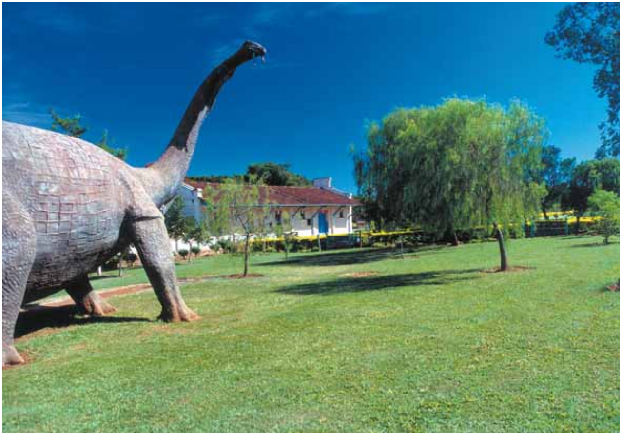
Figura 8 - Museu dos Dinossauros de Peirópolis - Uberaba-MG Figure 8 – Museum of the Dinosaurs of Peirópolis - Uberaba- state of Minas Gerais

Desde a implantação, o Centro Price tem norteado suas ações a fim de atender a três objetivos básicos: proteger os fósseis e depósitos fossilíferos, fomentar, apoiar e realizar pesquisas geo-paleontológicas e divulgar conhecimentos. Para agilizar os trabalhos e possibilitar a ampliação do acervo fóssil, a instituição possui equipes de escavações, com coletas sistemáticas anuais por 6 meses, únicas neste gênero no Brasil.