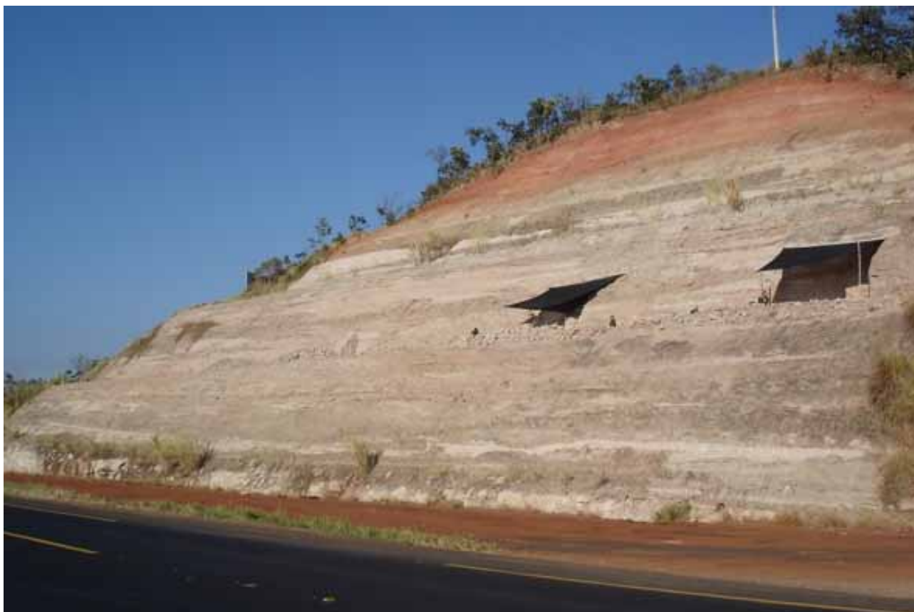
Figura 3 - Sítio Paleontológico da Serra da Galga - BR 050 - km 153 Figure 3 – Paleontological Site of Serra da Galga - BR 050 - km 153