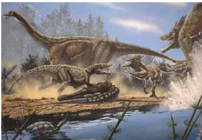
Figura 7 - Reconstrução ambiental da região de Uberaba há 70 milhões de anos.

Muitos fósseis de vertebrados cientificamente relevantes provêm da Formação Marília, em especial da região de Peirópolis. Há um importante anfíbio - Baurubatrachus pricei Baez & Peri, 1989 - o qual encontra-se praticamente completo (Baez & Peri, 1989). Dentre os crocodilomorfos temos Itasuchus jesuinoi (Price, 1955), Peirosaurus tormini (Price, 1955) e Uberabasuchus terrificus (Carvalho, et al. , 2004). Outros répteis são: um lagarto iguanídeo Pristiguana brasiliensis (Estes & Price, 1973), e um dinossauro maniraptora relacionado aos dino-aves (Novas et al. , 2005). Também ovos fósseis são conhecidos desta região (Magalhães Ribeiro, 1999). (Fig. 7)