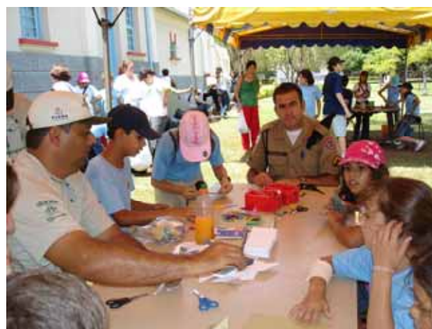
Figura 11 - Oficinas Pedagógicas durante a Semana dos Dinossauros