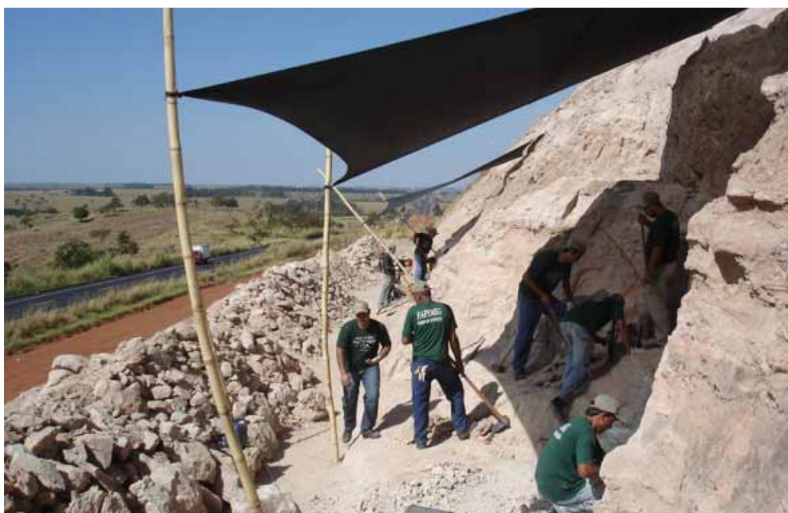
Figura 4 - Escavações paleontológicas realizadas no km 153 da BR 050 Figure 4 – Paleontological excavations performed in km 153 of BR 050 road

Ainda que muito trabalho já tenha sido executado toda esta região ainda encontra-se intocada. Possui imensas áreas potencialmente fossilíferas que, com o