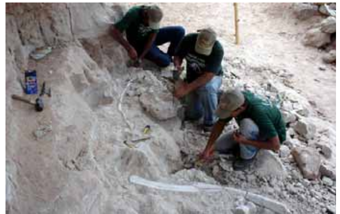
Figura 9 - Escavações paleontológicas sistemáticas realizadas no km 153 da BR 050 Figure 9 – Systematic paleontological excavations performed in km 153 of BR 050 road

mamíferos crustáceos de água doce além de microfósseis de plantas.