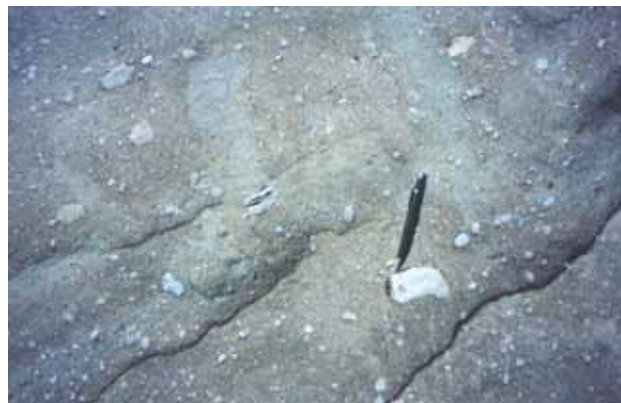
Figura 4 – Detalhe da fácies de conglomerado matriz-suportado que representa a rocha mais comumente observada no Vale da Lua.

milimétricos a decimétricos, sub-angulosos a sub-arredondados, com raros grãos bem arredondados ou bem angulosos, mostrando esfericidade média à baixa (Fig. 4). A rocha é matriz-suportada, sendo a matriz atualmente representada por uma mistura mal graduada de areia, silte e carbonatos. O carbonato ocorre na forma de cristais euhédricos e como uma massa pouco cristalina. Os cristais de carbonato mais grossos apresentam tons vermelhos a arroxeados.