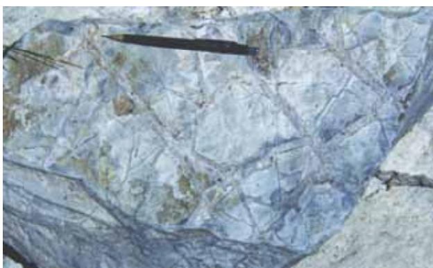
Figura 9 - Gretas de ressecamento em nível pelítico laminado das porções distais dos leques aluviais.

A observação das seções delgadas corrobora a variação morfológica observada em afloramentos, sendo que os fragmentos líticos apresentam-se subangulosos a subarredondados com predominância do primeiro tipo, e com esfericidade média a baixa. Nos fragmentos quartzíticos foram identificados cerca de 15% de feldspatos, revelando que sua cristalização se deu, mais especificamente, a partir de fragmentos de subarcóseo. As dimensões dos grãos siltosos variam desde milímetros até aproximadamente 6 cm, em contraposição a dimensão dos grãos de subarcóseo, que variam de milímetros a cerca de 3 cm. Proporcionalmente há uma maior porcentagem de fragmentos de subarcóseo e quartzito, quando comparados a porcentagem de fragmentos silticos, sendo que em sua totalidade ocupam em média 40% da composição das lâminas estudadas.