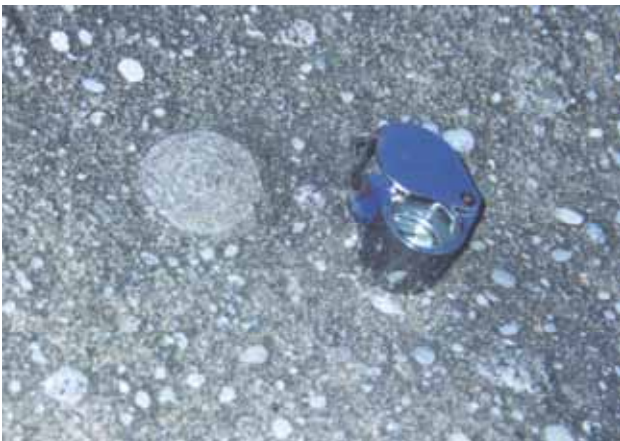
Figura 5B – Concreção carbonática encontrada no arcabouço dos conglomerados matriz suportados.

Figure 5A – Carbonate concretion formed by chemical precipitation in the diagenetic stage of the lithification. There is iron oxide contribution.