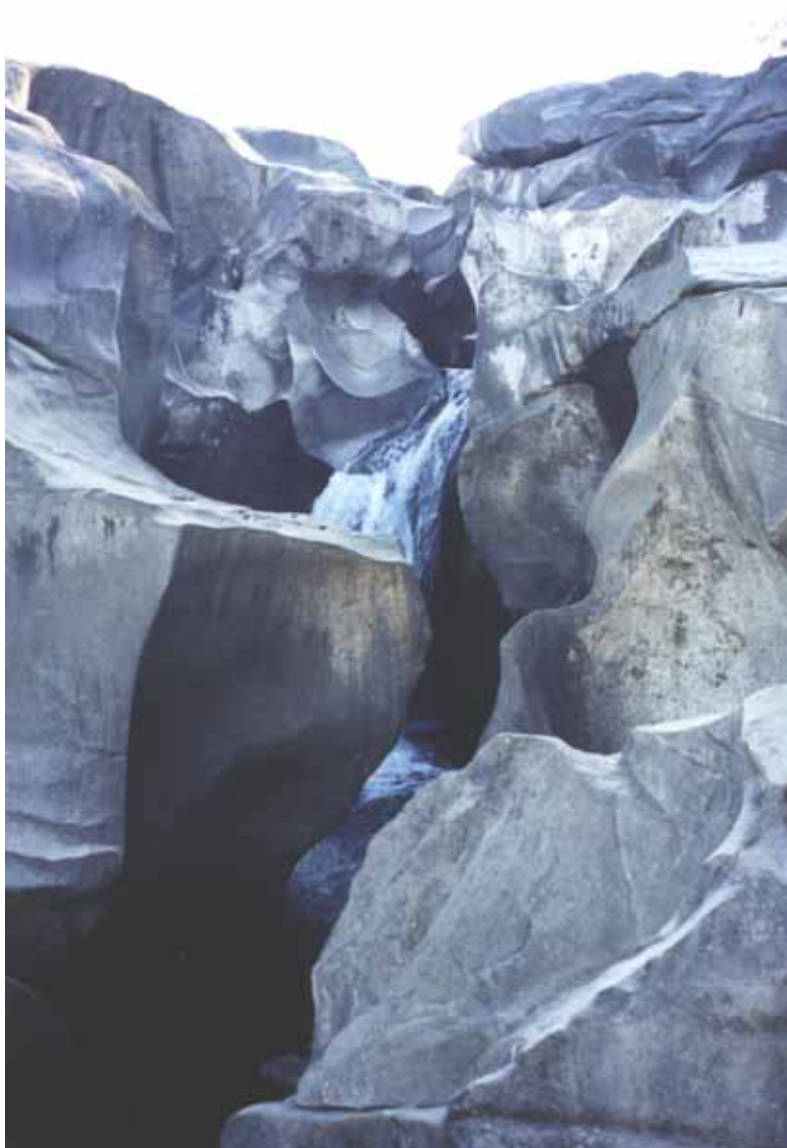
Figura 2 – Figuras erosivas observadas no trecho principal do Vale da Lua. O processo de abrasão hídrica é facilitado pela presença do carbonato como matriz/cimento. As “esculturas naturais” e o aspecto liso do leito são os detalhes de principal interesse pelos visitantes.

Figure 2 – Erosive features observed in the main section of the Vale da Lua Site. The erosion processes are controlled by the carbonate present as matrix and cement. The “natural sculptures” and the general aspects of the area are the details of more interest by the visitors.