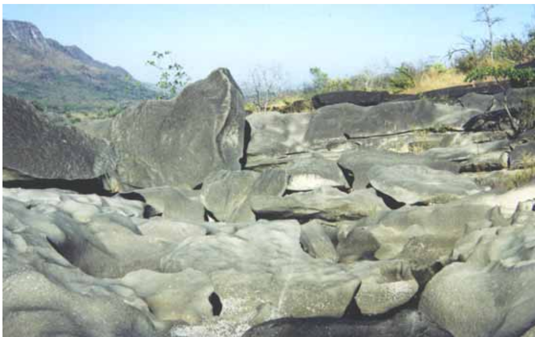
Figura 1 – Aspecto geral do conglomerado onde há contínua abrasão da superfície da rocha pela água. Nesse trecho o Ribeirão São Miguel corre encaixado nas fendas em função da dissolução do carbonato presente na rocha.

Figure 1 – General aspect of the conglomerate that is continually reworked by fluvial abrasion. On this region the São Miguel stream flows in narrow canyons due to the carbonate dissolution.