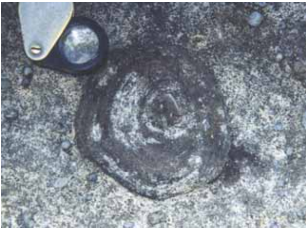
Figura 5A – Concreção carbonática que representa uma estrutura pós-deposicional formada por precipitação química. Nesse caso há contribuição de óxidos de ferro.

Figure 5A – Carbonate concretion formed by chemical precipitation in the diagenetic stage of the lithification. There is iron oxide contribution.