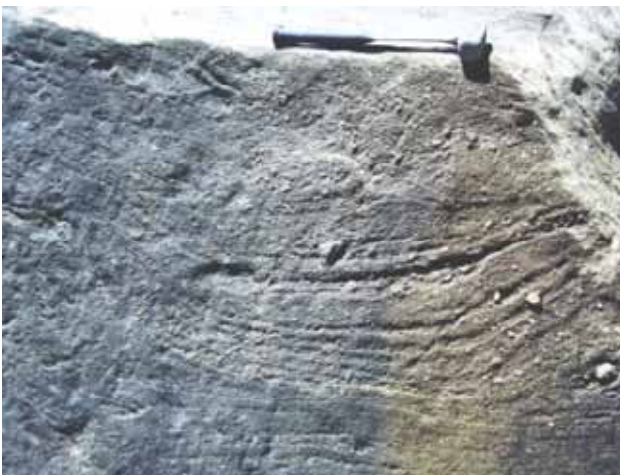
Figura 6 – Conglomerado fino, laminado, com estrutura convoluta e mal selecionamento, típico das fácies distais de leques aluviais.

Figure 5B – Carbonate concretion observed as a pseudo clast in matrix-supported conglomerate.