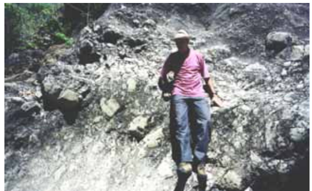
Figura 7 – Fácies de brecha intraformacional com blocos e calhaus de quartzitos associada a fácies de conglomerados maciços. Observar a natureza angulosa da maior parte dos clastos.

Essa fácies é maciça e, apenas localmente nas maiores exposições, pode-se observar um acamamento difuso ou feições erosivas na base de amplos canais.