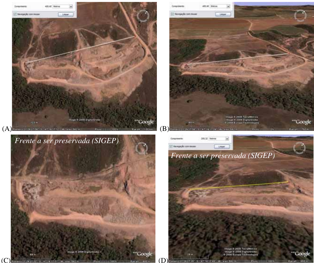
Figura 6 - Imagens de satélite da área de exploração ativa no momento (A e B) Frente total de exploração e extração do calcário; (C e D) Disposição da área passível de seleção para ser preservada do sítio paleoambiental, onde está a melhor exposição dos estromatólitos (trecho de aproximadamente 200 metros)

Figure 6 – Satellite images of under exploration area at the present (A and B) , entire area under mining activities and limestone exploration; (C and D) air view of potential preservation area, the best exposition with stromatolites (almost 200 m of extension)