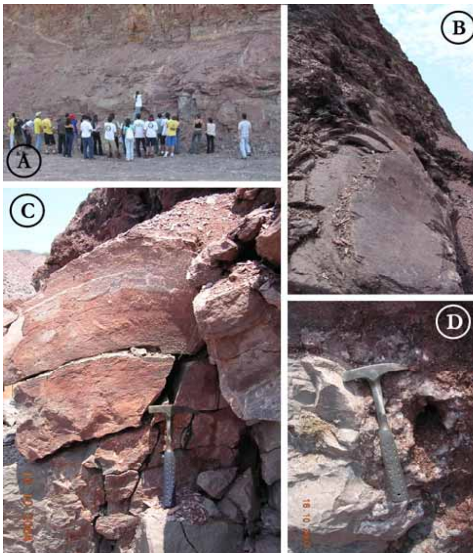
Figura 3 – Estromatólitos gigantes (A), contato entre o Subgrupo Irati e a Formação Corumbataí (B); perfil de um estromatólito com ossos desarticulados de mesossaurídeos na base (C) e geodo de calcita entre dois estromatólitos (D) Figure 3 – Giant stromatolites (A), contact between Irati Subgroup and Corumbataí Formation (B); profile of a stromatolite with disarticulate bones of mesosaurids at base (C) and calcite geode between two stromatolites.

tempestades já haviam sido relatadas em outras localidades no Subgrupo Irati entre Rio Claro e Angatuba, dentro da Formação Assistência. Mais recentemente, Caíres (2005) e Caíres et al. (2005) efetuaram uma coleta de abundante material paleontológico e correlacionaram o sítio como sendo pertencente ao Subgrupo Irati no estado de São Paulo, retomando o estudo do local supracitado.