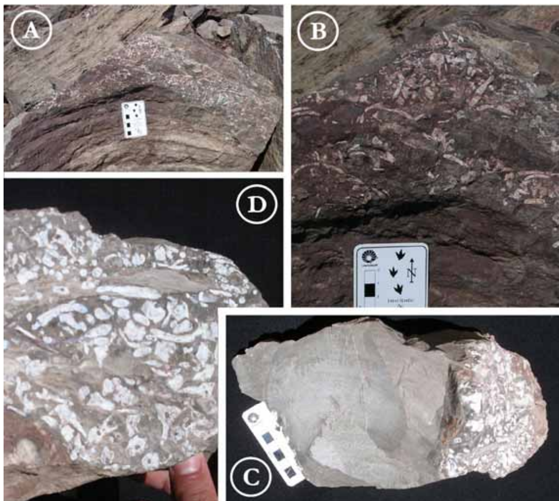
Figura 4 – Fragmentos de estromatólitos com ossos desarticulados de mesossaurídeos (A, B, C e D), notar em D vértebras com hipófises bem preservadas.

amostras da porção explorada mostrada na Figura 6, onde a lavra está sendo desenvolvida atualmente e onde está localizada a melhor exposição do campo de estromatólitos gigantes.