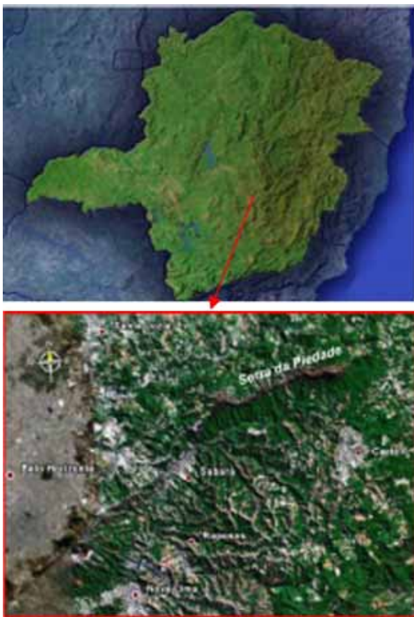
Figura 2 - Localização da Serra da Piedade em imagem de satélite. Figure 2 – Location of the Serra da Piedade in the Minas Gerais.