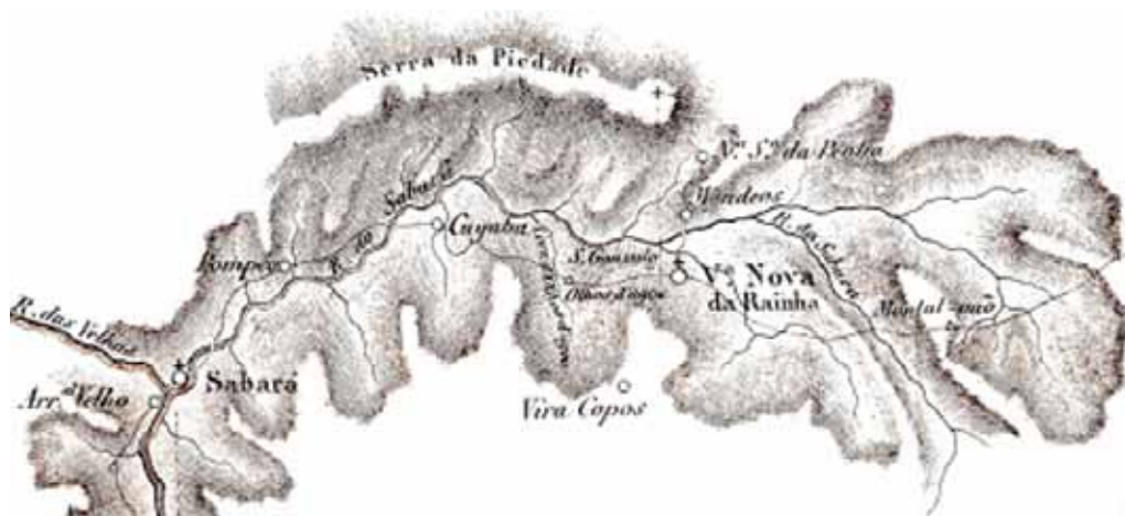
Figura 9 - Mapa topográfico da bacia do Rio do Sabará, delimitada ao norte pela Serra da Piedade. Fonte: Eschwege, 1832 Figure 9 - Topographic map of the valley of the Sabará River and the Serra da Piedade. Source: Eschwege, 1832.

intemperismo e formação de superfícies de canga se desenvolveram no início do Terciário (Spier, 2005).