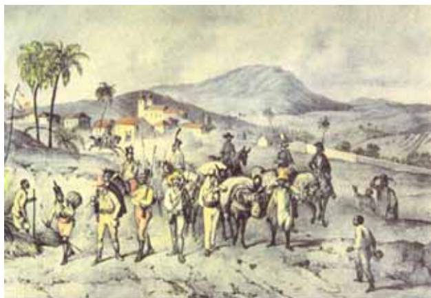
Figura 3 - Comboio de diamantes passando por Caeté com a Serra da Piedade ao fundo. (Desenho de J.M. Rugendas, 1824) Figure 3 – Diamond convoy passing through Caeté with the Serra da Piedade in the background. (Draft by J.M. Rugendas, 1824).

Uma outra expedição que saiu em busca da famosa serra, supostamente rica em prata e esmeraldas, foi a bandeira de Fernão Dias Paes Leme que partiu de São Paulo em julho de 1674, composta