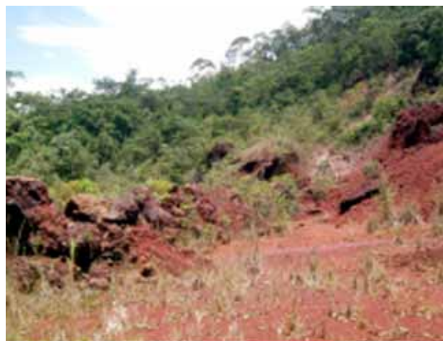
Figura 7 - Escavação em canga no sopé da Serra da Piedade; a canga é usada para construção de estradas.

Figure 6 - Iron ore mining in itabirite at the northern foothills of the Serra da Piedade.