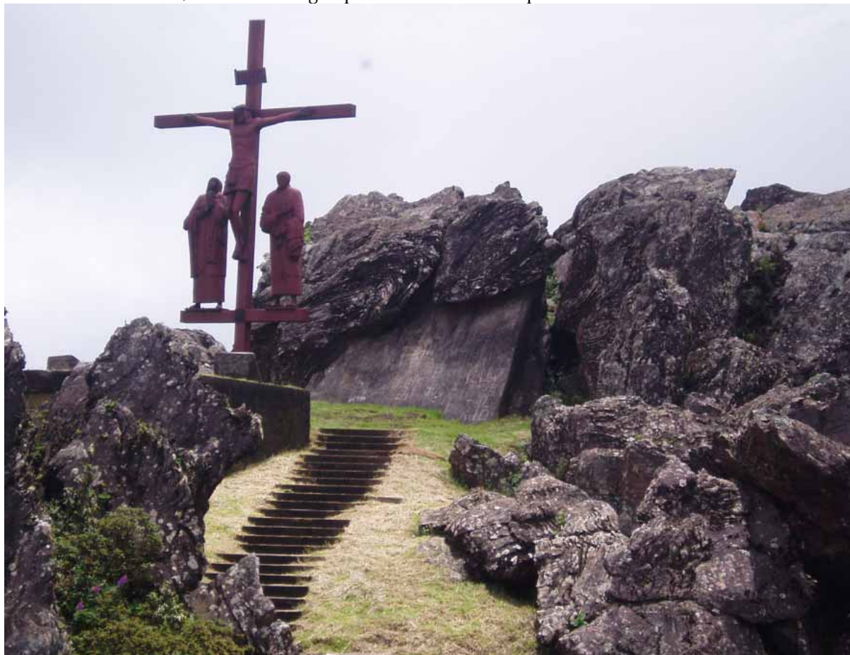
Figura 1 - Crucifixo ladeado por Maria e São João no alto da Serra da Piedade, Minas Gerais, obra do artista plástico romeno Vladi Poenaru, representando a simbiose entre religião e natureza.

estrada asfaltada com aproximadamente 6 km de extensão que sobe a serra.