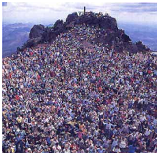
Figura 13 - Romeiros em missa campal no alto da Serra da Piedade.

O valor religioso da Serra fez com que, em novembro de 1958, o Papa João XXIII consagrasse a imagem do Santuário de Nossa Senhora da Piedade como Padroeira do Estado de Minas Gerais. Todo ano, entre 15 de agosto e 7 de setembro, acontece o jubileu em sua homenagem reunindo milhares de fiéis no alto da Serra da Piedade (Figura 13).