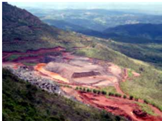
Figura 6 - Mina em itabirito na encosta norte da Serra da Piedade.

alvo de estudos e mapeamentos geológicos, sendo o mapa de Peter Claussen, de 1841, o primeiro a ser impresso (Fig. 8).