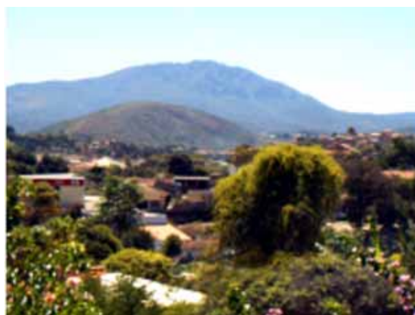
Figura 4 - Vista da Serra da Piedade tomada do sul a partir de Caeté (no primeiro plano). Figure 4 – View of the Serra da Piedade looking from Caeté (in the foreground).

Mesmo sem ter encontrado prata ou esmeraldas, a expedição foi importante pela descoberta de ouro decorrente das pesquisas de Borba Gato e Garcia Rodrigues Paes no Rio das Velhas e seus afluentes. Segundo Renger (2006), a ausência de um escrivão na bandeira não permite uma reconstituição exata dos fatos; provavelmente a notícia da descoberta do ouro se espalhou entre os paulistas que, aos poucos, se deslocaram para as novas minas, nas últimas décadas do século XVII, quando se multiplicaram os achados de ouro.