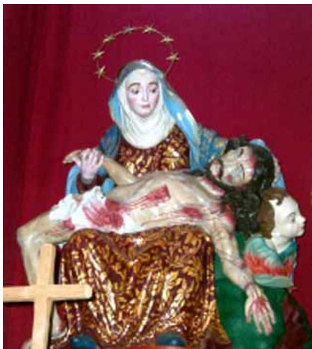
Figura 12 - Imagem de N.S. da Piedade (escola portuguesa, séc. XVIII).

capela fosse um referencial para o andarilho penitente ansioso por um local adequado para orar e aproximar-se de Deus. Segundo Duarte (1992), a história de Bracarena foi reconstruída pela descoberta de alguns documentos, inclusive, uma carta de próprio punho. Ao que tudo indica, Bracarena veio ao Brasil com o objetivo de enriquecer e voltar à terra natal, mas abandonou este projeto após ouvir a história sobre a aparição da Nossa Senhora da Piedade.