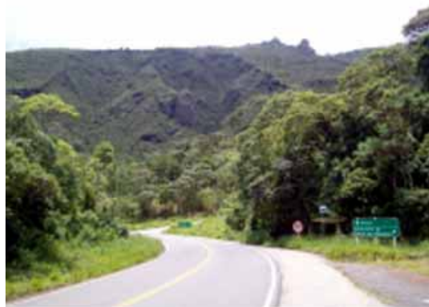
Figura 11 - Encosta norte da Serra da Piedade, mostrando a variação da vegetação da mata tropical (primeiro plano) para campo rupestre de altitude. Nota-se ainda a erosão regressiva, recortando o capeamento de canga.

características físicas da Serra proporcionam o desenvolvimento de vários tipos de vegetação que ainda estão bem preservadas. À medida que se sobe, a vegetação diminui de porte. No sopé, tem-se a mata fechada de encosta, remanescente da floresta tropical; a partir desse nível, a vegetação torna-se mais aberta e de menor porte. No topo as áreas cobertas pela canga suportam uma cobertura de campo rupestre que se desenvolve tipicamente sobre as formações ferríferas do Quadrilátero Ferrífero. As plantas crescem sobre um solo composto de fragmentos muito duros (canga nodular) ou sobre rochas com fendas onde as raízes podem penetrar (Fig. 11).