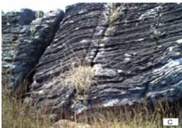
Figura 5 - Aspectos de afloramentos de itabirito no alto da Serra da Piedade: a) Dobramento decimétrico pouco apertado em itabirito; b) dobras do tipo “chevron”; c) lixiviação seletiva das bandas de quartzo, realçando as bandas de hematita.

Figure 5 - Outcrops of itabirite at the Serra da Piedade: a) semi-open folds in thinly laminated itabirites; b) chevron folds; c) differential lexiviation of quartz layers, emphasizing the hematite layers.