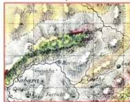
Figure 8 - Geological map of Quadrilátero Ferrífero by P. Claussen (1841), in detail the Serra da Piedade, green is the so-called “siderochriste” (iron formation).

Na Serra da Piedade afloram rochas do Supergrupo Minas, a saber: itabiritos (formações ferríferas) da Formação Cauê (Grupo Itabira) e filitos da Formação Cercadinho (Grupo Piracicaba). Os afloramentos de itabirito da Formação Cauê atingem na serra grande espessura, bem expressiva em termos didáticos e científicos (Fig. 5: a, b, c).